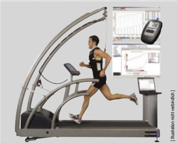
[ Illustration nicht verbindlich ]